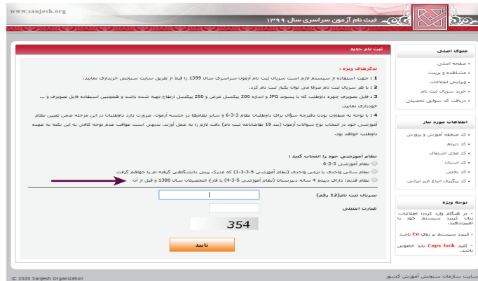
(تصویر شماره یک)

این داوطلبان بعد از بارگیری عکس و تأیید، وارد محیط تقاضانامه شده و لازم است نسبت به تکمیل بندهای تقاضانامه ثبت نام اقدام نمایند.