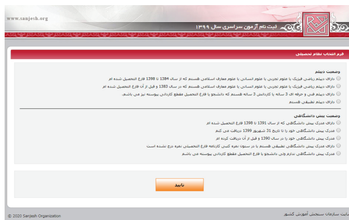
(تصویر شماره سه)

➤ داوطلبان لازم است با توجه به سال اخذ دیپلم و یا پیش‌دانشگاهی و یا مدرک کاردانی، نسبت به علامتگذاری موارد مندرج در این صفحه اقدام نموده که در این صورت داوطلبان با توجه به نوع علامتگذاری بندها، کسانی که مشمول سوابق تحصیلی هستند با ورود کد سوابق تحصیلی و کد دانش آموزی و سپس مشاهده سوابق تحصیلی خود اقدام نمایند. این داوطلبان پس از تأیید سوابق تحصیلی وارد صفحه بارگذاری عکس (تصویر شماره ۴) شده و پس از بارگذاری وارد محیط تقاضانامه ثبت‌نامی شده و نسبت به تکمیل بندهای مورد نیاز اقدام نمایند.