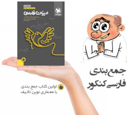
اولین کتاب جمع بندی با معماری نوین تألیف