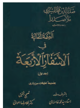
کتاب الاسفار الاربعه