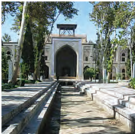
مدرسه صفویه در اصفهان