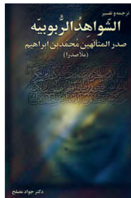
کتاب الشواهد الربوبیه (سوال)

امام خمینی علیه السلام پاسخ داد: «این سؤال احتیاج به تأمل دارد و الان نمی‌توانم جواب بدهم اما شاید بتوان گفت در فلسفه، ملاصدرا، در کتب حدیث، کتاب کافی در کتب فقهی، کتاب جواهر...»