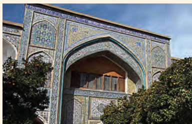
مدرسه خان شیراز