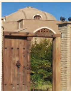
منزل ملاصدرا در کهک قم

ملاصدرا در مذمت اوضاع زمانه که او را ناچار به مهاجرت کرد، می‌گوید: