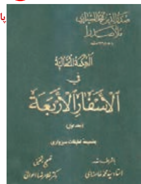
کتاب الاسفار الاربعه

ملاصدرا تألیفات متعددی دارد که همه آنها در جایگاه خود مهم و منشأ اثر بوده‌اند، مانند «الشواهد الربوبیه»، «تفسیر القرآن الکریم» و «المبدأ و المعاد». ۱ ۲ (مهم‌ترین و مشهورترین اثر فلسفی ملاصدرا «الحکمة المتعالیة فی الاسفار الاربعه» می‌باشد که دایرةالمعارف فلسفی ملاصدرا است. این کتاب که به «اسفار» مشهور است و در نه جلد به چاپ رسیده، با الهام از سفر چهار مرحله‌ای عارفان در چهار بخش اصلی تألیف و تنظیم شده است.) ۲ عرفا معتقدند که سیر و سلوک انسان به سوی کمال و تارسیدن به کمال نهایی در چهار سفر انجام می‌شود: انها را نام ببرید و هر کدام را توضیح دهید؟