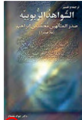
کتاب الشواهد الربوبیه سوال

۱ (خلوت‌گزینی و تفکرات و تأملات عمیق و طولانی و عبادت‌ها و ریاضت‌ها به تدریج عقل و جان صدرالدین را برای جهشی بلند در سپهر معرفت و حکمت مهیا ساخت. انوار حکمت بر او تابید و الطاف الهی پیوسته بر وی جاری گشت. اسرار و رموزی بر او آشکار شد که تا آن زمان آشکار نشده بود. وقتی آنچه را پیش از آن به برهان فرا گرفته بود از راه شهود قلبی به نحو برتر مشاهده کرد،) پس از حدود ۱۵ سال بار دیگر به شیراز بازگشت. این بار (حاکم شیراز سرپرستی «مدرسه خان» را به او سپرد و او این مدرسه را به کانون اصلی علوم عقلی در ایران تبدیل کرد و واپسین دوره زندگی خود را یکسره وقف تعلیم و تألیف کتاب نمود.) ۲ بالاخره، این بزرگ‌مرد عرصه حکمت و عرفان، در سال ۱۰۵۰ هجری قمری در هفتاد سالگی در راه بازگشت از سفر حج، در عراق درگذشت. ۲