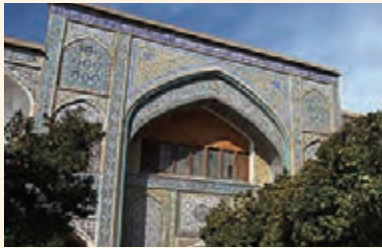
مدرسه خان شیراز