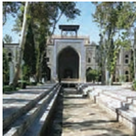
مدرسه صفویه در اصفهان