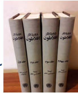
مجموعه آثار افلاطون

۴ (ارسطو نظر استاد خود افلاطون را پذیرفت که قوه نطق و قابلیت حیات مربوط به نفس است، نه بدن. بدن بدون نفس، یک موجود مرده است. از نظر ارسطو نفس انسان در هنگام تولد، حالت بالقوه دارد و هیچ چیز بالفعلی ندارد، نه علم، نه احساس، نه محبت و نه نفرت و نه هیچ چیز دیگر. نفس، به تدریج این امور را کسب می کند و به «فعلیت» می رسد و کامل و کامل تر می شود (مقصود از «ناطق» بودن انسان هم صرفاً سخن گفتن او نیست، بلکه مقصود اصلی، قوه تفکر و تعقل است) انسان با قوه تفکر خود استدلال می کند؛ یعنی از تصدیقات و تصورات خود کمک می گیرد و استدلال را سامان می دهد. گویا در هنگام استدلال، با خود نطق می کند. پس از تنظیم استدلال نیز با سخن گفتن و نطق، محتوای استدلال را به دیگران منتقل می نماید. (۶)