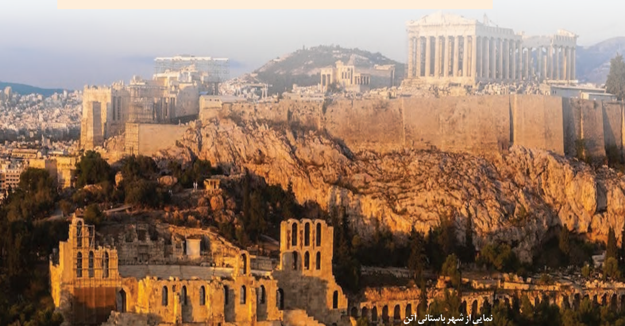
نمایی از شهر باستانی آتن

آن روزها، شهر آتن حال و هوای دیگری داشت. در هر کوی و برزن، به ویژه در میدان شهر، سخن از مردی بود که می گفتند به زودی محاکمه می شود. مردی که همه او را می شناختند. دیرزمانی بود که سخنان شیرین و پرمعنای او بر سر زبان ها بود. سخنان به ظاهر ساده و گاه خنده آورش ژرفای خاصی داشت. لباس های ساده می پوشید. اخلاق و منش جذابی داشت. رفتار متواضعانه و همراه با احترام او موجب شده بود جوانان زیادی مجذوبش شوند. او هر روز در شهر به راه می افتاد و نزد بازاریان، مردم عامی و اعیان و اشراف می رفت و با آنان حرف می زد و پیوسته درباره مسائل روزمره زندگی می اندیشید و با مردم سخن می گفت.