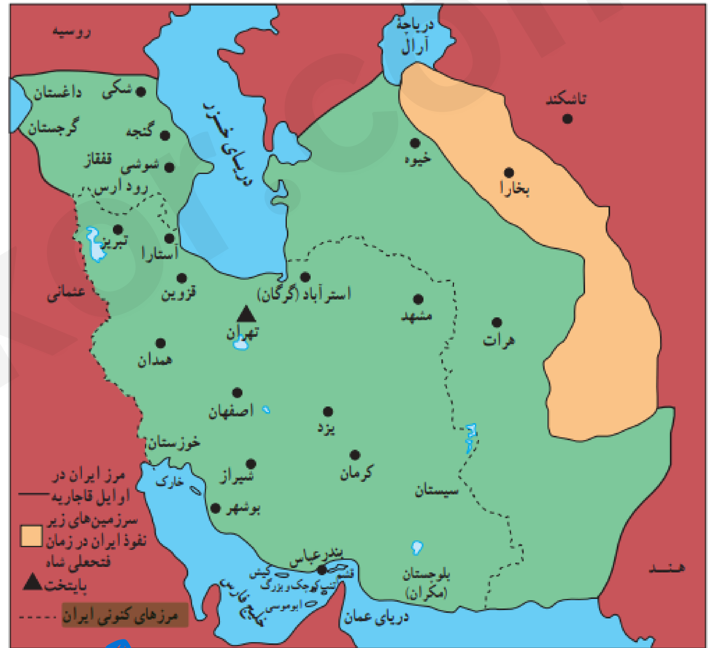
قلمرو ایران (در اوایل قاجاریه)