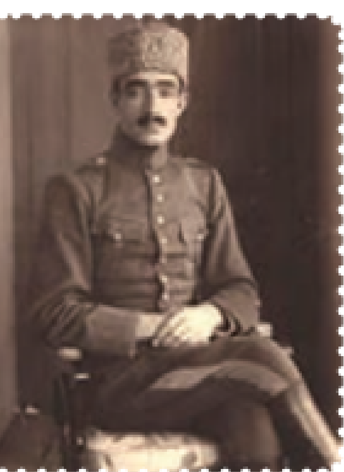
محمد تقی خان پسیان

در تبریز، گلنل محمدتقی خان پسیان در خراسان و تنگستانی‌ها در جنوب، با حمایت علمای فارس، قیام‌های بی‌دری را علیه نفوذ انگلستان سازمان دادند. این مسائل، به اضافه مخارج سنگین پلیس جنوب که از سوی انگلیسی‌ها اداره می‌شد و اهمیت روزافزون نفت، ضرورت وجود یک حکومت مرکزی مقتدر وابسته را، برای انگلستان، دو چندان می‌کرد. ۱