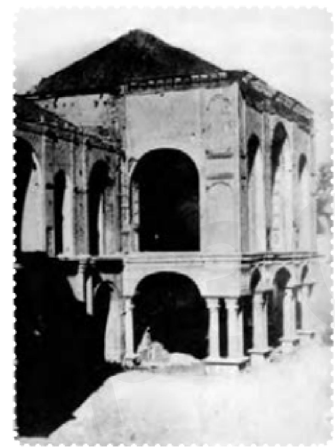
ساختمان مجلس شورای ملی پس از به توب بستن توسط لیاخوف در ایام مشروطیت

ملک المتکلمین و سید جمال الدین واعظ اعدام شدند. بعضی از نمایندگان نیز که مورد تعقیب قرار گرفته بودند (از جمله تقی زاده)، به سفارت انگلیس پناه بردند. بدین گونه، دوباره، برای مدتی، استبداد حاکم شد. این دوره که یک سال به طول انجامید بار دیگر استبداد به جای مشروطیت حاکم شد. از این رو آن را دوره استبداد صغیر نامیده اند.