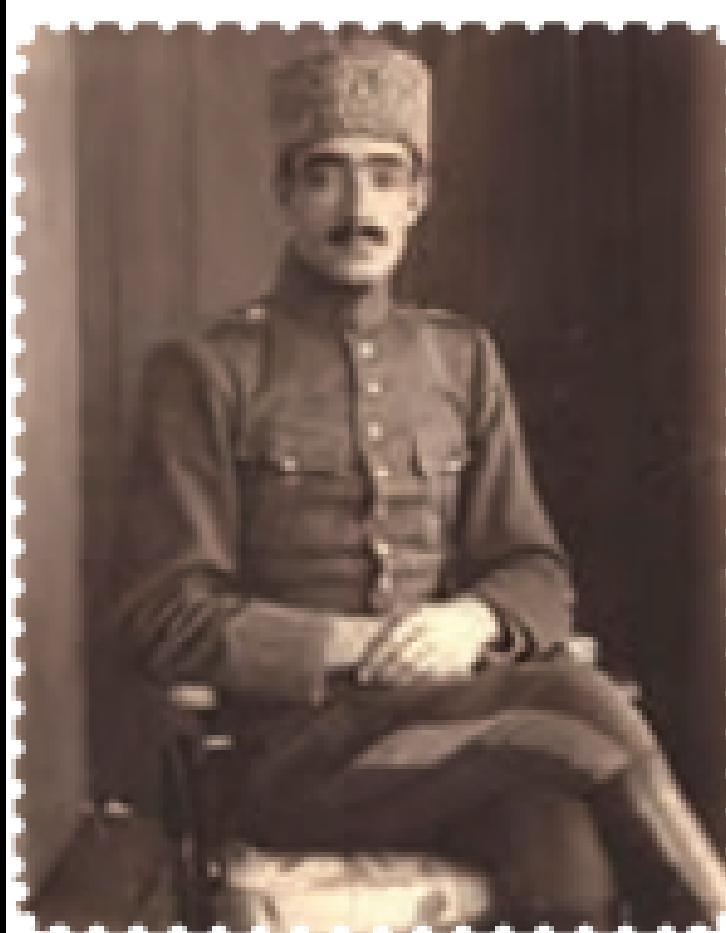
محمد تقی خان پسیان

پس از جنگ جهانی اول در واکنش به نفوذ بیگانه و فساد حاکم بر کشور جنبش‌های ضد استعماری در نقاط مختلف کشور، شکل گرفت. از جمله این جنبش‌ها می‌توان به موارد زیر اشاره کرد: • میرزا کوچک خان، روحانی مبارز، در گیلان (موسوم به جنبش جنگل)