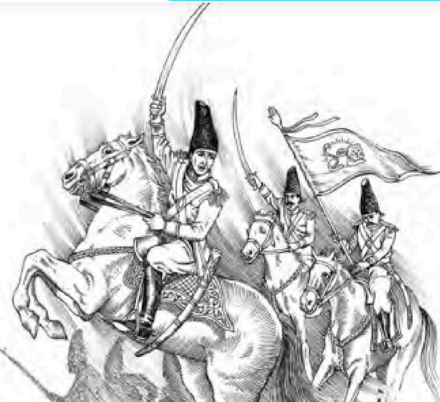
آقا محمدخان مؤسس حکومت قاجاریه

به این ترتیب، آقامحمدخان توانست سلسله قاجار را در ایران بنیاد نهد. وی تهران را که در آن زمان روستایی در حومه ری بود به پایتختی برگزید. این سلسله از سال ۱۱۷۴ تا ۱۳۰۴ ش، یعنی قریب ۱۳۰ سال، بر ایران فرمانروایی کرد.