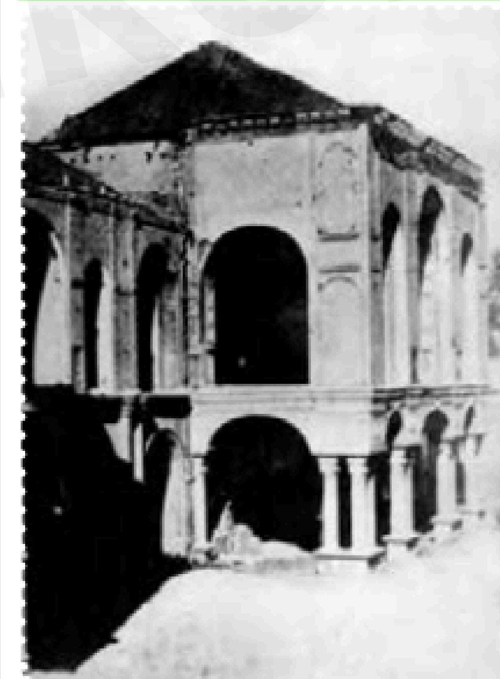
ساختمان مجلس شورای ملی پس از به توپ بستن توسط لیاخوف در ایام مشروطیت

به دنبال کشمکش بین محمد علی شاه و مجلس، محمدعلی شاه برای مبارزه با مشروطه خواهان، امین السلطان را از اروپا به ایران دعوت کرد تا ضمن سپردن ریاست دولت به او که از مخالفان جدی مشروطه بود، دوباره نظام استبدادی را حاکم سازد. سیاست دوگانه امین السلطان سرانجام به ترور او توسط یکی از طرفداران مشروطه انجامید. چندی بعد محمدعلی شاه نیز در یکی از خیابان های تهران مورد سوء قصد قرار گرفت و این اقدام را به مشروطه خواهان نسبت داد و به همین بهانه، تصمیم گرفت مجلس را برای همیشه تعطیل کند. بنابراین، در تیر ۱۲۸۷، یعنی دو سال پس از استقرار مشروطه، محمد علی شاه با تشویق سفارت روسیه دستور حمله به مجلس شورای ملی را صادر کرد. لیاخوف روسی فرمانده نیروهای قزاق به فرمان محمدعلی شاه با نیروهای خود به مجلس حمله کرد و بخشی از