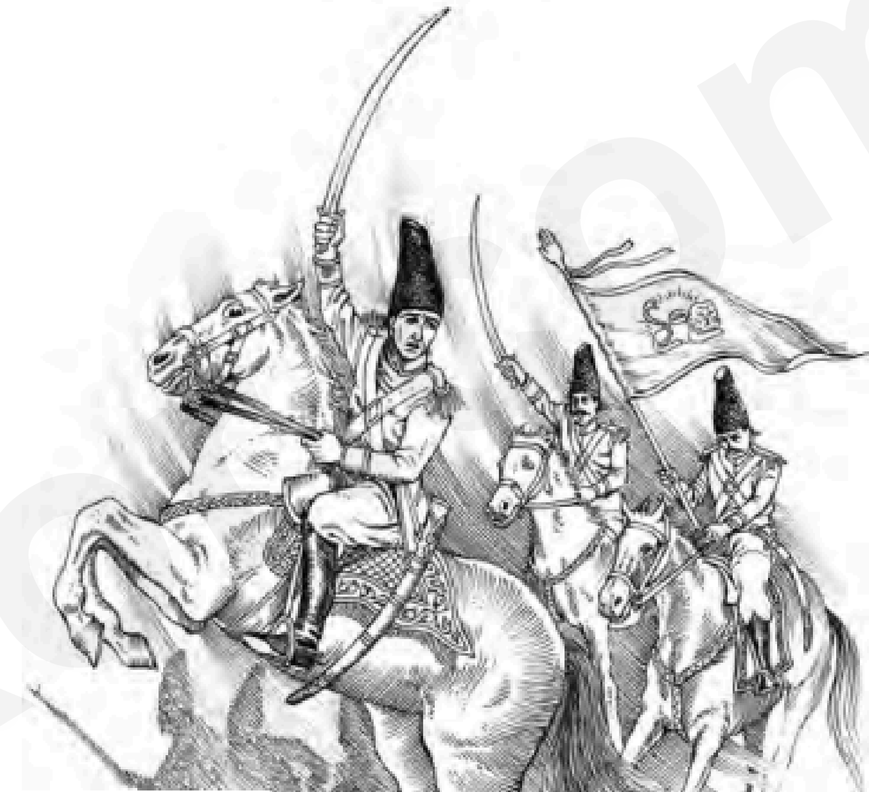
آقا محمدخان مؤسس حکومت قاجاریه

به این ترتیب، آقامحمدخان توانست سلسله قاجار را در ایران بنیاد نهد. وی تهران را که در آن زمان روستایی در حومه ری بود به پایتختی برگزید. این سلسله از سال ۱۱۷۴ تا ۱۳۰۴ ش، یعنی قریب ۱۳۰ سال، بر ایران فرمانروایی کرد.